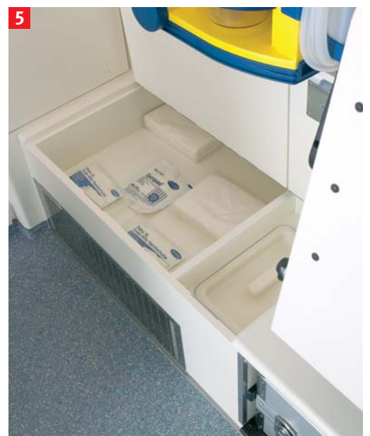
Bild 5: Im Sitzbankschrank zwei geräumige Klappfächer, davon eine mit integriertem Abfallbehälter.

Bild 4: An der Trennwand bequemer Betreuersitz mit Automatik-3-Punkt-Gurt, darunter Schrank mit offenem Fach für Notfallkoffer.